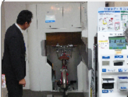
機械式駐輪場(自動です!)

高松市 人口:約41万人(品川区:約34万人)、面積:約375km 2 香川県は日本最小の県ですが、スーパーマーケットが乱立しています。高松市周辺でも5万m 2 、4万m 2 級がたくさん(ちなみにイトーヨーカドー大井町店は1.3万m 2 )。高松市は、商店街の活性化を目指し、空き店舗率の18.1%を14.2%に、通行量12万人を15万人に、が目標(平成23年)です。その1つが丸亀町商店街再開発事業。利権が複雑にからむ土地問題を解消する方法を考案したり、商店街全体をまちづくり会社が一括して運営したり、駐車場や駐輪場(左写真)を整備して、活性化を図っています。商店街の中心地には、銀座のようなブランドショップがテナントに入っていました。