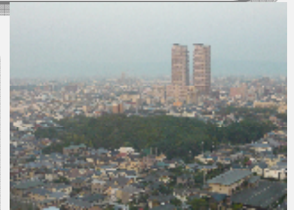
堺市には世界最大の仁徳陵古墳(正式名称:大仙(だいせん)陵古墳)があります。

堺市 人口:約83万人、面積:約150km 2 『自転車を活かしたまちづくり』を調査しました。自転車道の整備(自転車歩行者道の整備)や車道に自転車レーンを設置したり、河川沿いにサイクリングロードの整備、自転車道のネットワーク化を図っています。市民が作成した自転車地図(サイクリングマップ)は、とても素晴らしいものでした。また、環境省の補助金で「コミュニティサイクルシステム」の導入をしています。これは、共有自転車を配置するサイクルポート(駐輪場)を市民や来訪者が自由に使用できる交通システムです(貸し自転車的な仕組み。千代田区も導入)。自転車による安全・利便と、そしてまちの賑わいを創出していました。