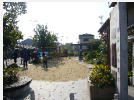
まちかど広場(りんりん広場)

大阪市 人口：約251万人、面積：約222km 2 品川区にも全国でワースト10に入る密集市街地がありますが、大阪市生野区では、『密集市街地の整備改善』を調査しました。民間老朽化住宅の建替えや狭い道路の拡幅整備を進めています。現地を視察しましたが、70年前(!)の住宅もありました。また、「まちかど広場」(約200m 2 。右写真)が設置され、これは、ミニ公園です。企画段階から地域住民が参加して話し合いをし、完成後も管理運営をしています。「私たちの公園」という意識があり、地域の市民が大切にしています。ゴミ1つ落ちていませんでした。15ヵ所設置予定とのこと。住民参加(協働)の好例です。品川区にもぜひ!