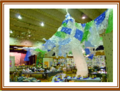
立会小学校(体育館)