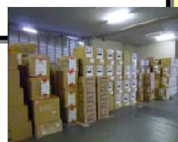
救援物資 (区役所1階)

☆支援物資の受付は、下記以降中止します。 地域センター—3/31まで、地域活動課 4/15まで