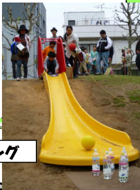
滑り台ボウリング