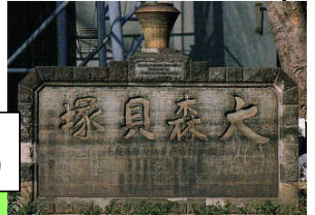
大森貝塚記念碑 (品川区大井1丁目)