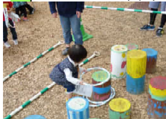
丸太ステップ輪投げ

3/26にオープンしていた当公園（東大井1丁目）で5/5の子ども日にスタンプラリーが開催されました。オープニングセレモニーが自粛されていましたが、子どもの日に合わせてイベントが開催されました。滑り台ボウリング、丸太ステップ輪投げ、お絵かき地面等、など。公園の遊具を利用した遊びばかりでした。当日は、公園が子どもたちの歓声であふれていました。なお、当日の様々なゲームは区職員のオリジナルですべて手作り。