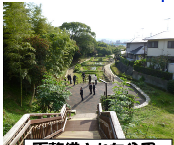
再整備された公園

【選定の流れ(1年間)】 公園の整備案募集 (市民 5 人一組で応募) ⇒提案説明(プレゼンテーション) ⇒中間公開審査会 ⇒市民・地域の意見聴取 ⇒最終公開審査会 ⇒市長が決定