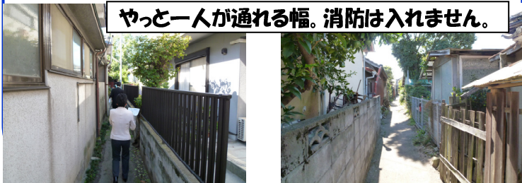
やっと一人が通れる幅。消防は入れません。

◇大分県大分市: 人口 48.7 万人、面積 501 km 2 「密集市街地整備」: 道路や公園などの公共施設が未整備のまま宅地化が進み、建物が密集し地震による倒壊、火災時の延焼による大火の恐れ等、防災上危険性の高い地区の整備状況(国交省の整備事業。10 年間 99.5 億円)を視察。