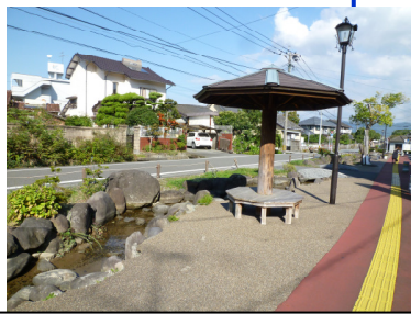
左：このような道路が続きます 右：休憩施設とせせらぎ