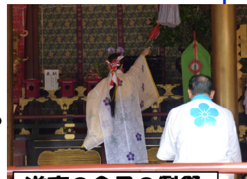
道真の命日の例祭

◇「環境税」：歴史と文化のまちを創造するため、主に太宰府天満宮周辺の駐車場利用者に法定外普通税 (自家用車 100 円、大型バス 500 円等) を課税して、その税収を環境保全等に活用しています。人口 7 万人の当市に観光客は、何と 722 万人です！そのうちの 200 万人は三が日の参拝客です (全国 10 位)。