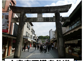
太宰府天満宮参道

福岡県太宰府市は、1300 年前に置かれた外国 (中国) との窓口であり九州を治めた大宰府 (役所) 跡や菅原道真をまつる太宰府天満宮など歴史遺産が多く存在します (市の 15% が国の史跡指定)。「百年後も誇りに思える美しいまち」づくりを目指し、景観形成のために様々なルールづくりを行っています。