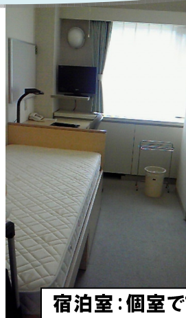
宿泊室:個室ですがちょっと窮屈...