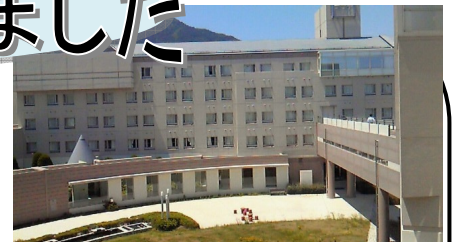
全国市町村国際文化研修所