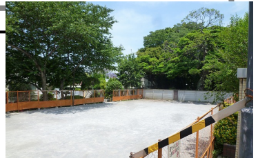
ネットが撤去されています

に実施することになりました。大雪でも壊れない構造にするため、大規模な工事になります。最長だと7、8月中は工事になる予定です。利用者の方々の「早急に!」というご要望をお伝えしましたが、破損した1月から半年も経過してしまうことを深くお詫び申し上げます。なぜ設計、工事計画等がこのように時間がかかるのか、もっとスピーディーにできないのか、きちんと検証します。ご不便をおかけしますが、ご理解の程、よろしくお願ひします。