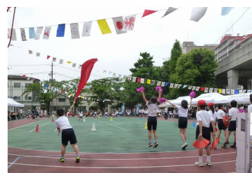
応援、気合!・鮫浜小

☆どの日も天候に恵まれ、学校は、児童・生徒・たかさんの保護者の笑顔と歓声があふれていました。運動会は、とても大切な行事です。先生方、準備・指導等、大変お疲れさまでした。