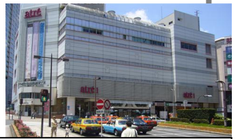
JR目黒駅東口(品川区)

大規模災害時、目黒駅周辺に帰宅困難者が出た場合の対策を考える協議会を品川区と目黒区が5/16に設立し、鉄道関係者や事業者らが集まった。複数の関係者による協議会設置は都内で初。目黒駅は、所在地は品川区上大崎で、目黒区との境に近い。目黒駅の1日の乗客数は、JR側が102,000人、東急側が115,000人。利用者の約6割が目黒区側という。大地震が起これば多数の帰宅困難者が出ると予想される。今後、駅周辺の地域ごとに行動ルールを決め、それに基づく訓練を来年2月に行う。参考：5/17東京新聞他