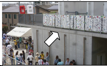
クラスメッセージ・伊藤学園