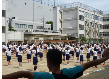
保護者も準備体操・東海中