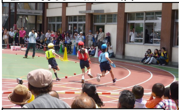
リレー、白熱!・山中小