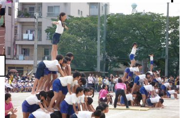
組体操成功!・鈴ヶ森小