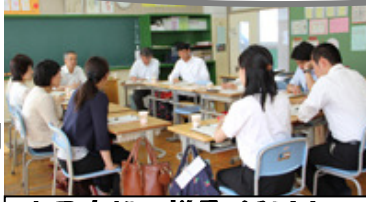
意見交換の様子：浜川中 (区ホームページより)

初日の6/5は、区立中や小中一貫校で全小学校教員が中学の授業を参観し、その後、いじめ根絶を念頭に小中教員による情報交換・意見交換を実施。11/6は、小中全教職員による「いじめ防止研修会」を、来年2/5は、中学校教員が小学校の授業を参観し、中学入学予定者に関する情報・意見交換を実施する予定。☆成果の報告を求めています6/11文教委員会、参考：6/6.7サカイ・朝日新聞