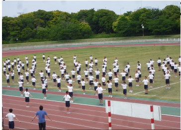
整理体操も広々・浜川中

6/1 東海中(346名、11クラス)⇒小中一貫校伊藤学園(小=612名、20クラス、中=557名、16クラス)⇒鮫浜小(135名、6クラス)⇒鈴ヶ森中(286名、9クラス)の順に見学しました。