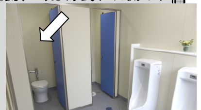
とってもきれいなトイレになりました (鈴ヶ森小)

クイズの答え: ⑤「マタニティマーク」です。厚生労働省が2006年に発表。妊産婦が交通機関等を利用する際に身につけ、周囲が妊産婦への配慮を示しやすくするもの。また、妊婦に優しい環境づくりを推進するものでもあります。「あの街…」参照