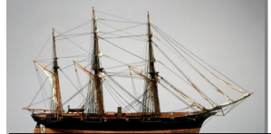
咸臨丸(かんりんまる)

「幕末・明治期に欧米各国に派遣され、日本の近代化に大きな役割を果たした外交使節団の出発地は品川と横浜でした。本特別展では、品川から世界に旅立った人々を中心