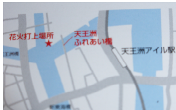
天王洲アイランドすぐそば