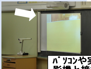
パソコンや実物投影機と接続

A: ① 配備したプロジェクターは、映像を鮮明に映写する機能に加え、スクリーンも反射しにくい高性能なものであり、特別な対応は考えていない。