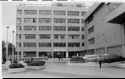
1968年落成当日 (「web写真館」)

☆休日出勤した職員は、代休を取るなので、開庁に関わる休日出勤手当等の費用はかかっていません。