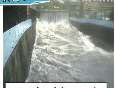
雨天時の未処理下水の放流状況