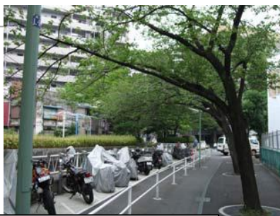
周囲との調和が図られていない立会道路