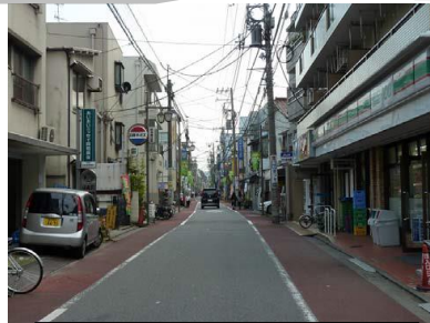
大井地区の旧東海道

品川宿地区(北品川)と異なり、具体的な取り組み(景観計画での重点地区指定、電線類地中化・石畳整備等)がなされてこなかった。