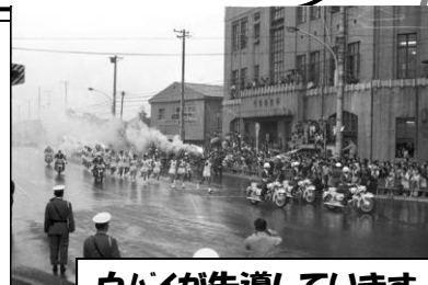
白バイが先導しています

クイズの答え: ②現在の品川健康センター(北品川3丁目)です。1964(昭和39)年当時は、写真の建物が品川区役所でした。沿道で多くの区民が声援を送りました。