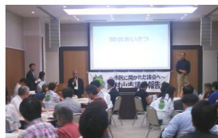
東村山市議会 議会報告会