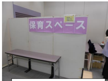
保育スペースも設置ご利用の方がいました