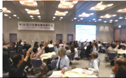
クイズ:手をあげていただきました