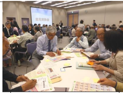
グループで活発な意見交換 議員も2人ずつ参加。

事故を受け、東京臨海高速鉄道は線内7駅のホームに「歩きスマホ 大変危険です」と注意を喚起するポスター計28枚(写真:天王洲アイル駅)を掲示。同社担当者は「痛ましい事故を起こさないために引き続き(危険性を)周知していく」としている。参考:5/30朝日新聞 ☆「歩きスマホ」が原因の事故が絶えません。消防・鉄道会社・携帯電話会社の啓発だけでなく、利用者のモラルが重要です。加害者にもなります。