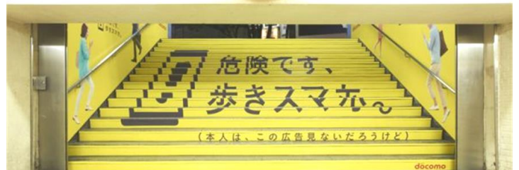
NTTドコモの広告:JR新宿駅の階段(2013年8月)

事故を受け、東京臨海高速鉄道は線内7駅のホームに「歩きスマホ 大変危険です」と注意を喚起するポスター計28枚(写真:天王洲アイル駅)を掲示。同社担当者は「痛ましい事故を起こさないために引き続き(危険性を)周知していく」としている。参考:5/30朝日新聞 ☆「歩きスマホ」が原因の事故が絶えません。消防・鉄道会社・携帯電話会社の啓発だけでなく、利用者のモラルが重要です。加害者にもなります。