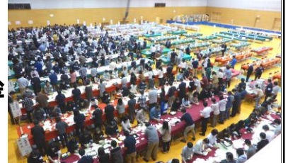
平成24年：衆院選開票所