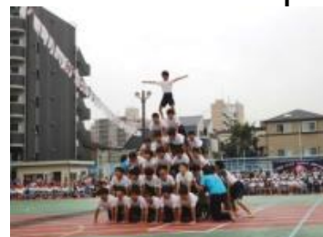
浜川小HP(平成27年)より