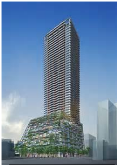
豊島区役所 (49階建て 下層部分)

Q: ①区は、JR広町社宅跡地(東急大井町線大井町駅すぐ脇)の隣に土地を所有している(注:区立ひろまち保育園、劇団四季劇場がある)。有効活用のため、JR広町社宅跡地と交換し、庁舎の建て替え計画を検討しては、どうか。