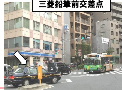
三菱鉛筆前交差点