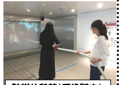
防災体験館(区役所内)で消火(放水)体験