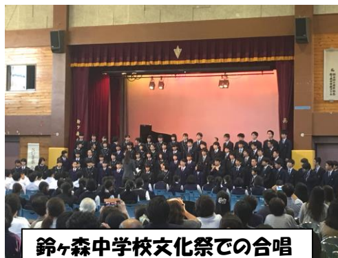
鈴ヶ森中学校文化祭での合唱