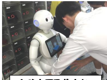
イベントでロボットと