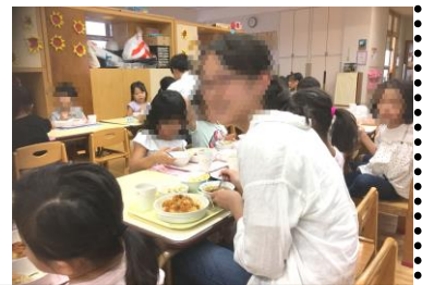
幼稚園と保育園の一体施設見学。給食も一緒に♪

クイズの答え：③ 8位。1位 千代田区、2位 港区、3位 中央区、4位 新宿区、5位 渋谷区、6位 文京区、7位 江東区、9位 台東区、10位 目黒区。上位3区は、生活・居住分野の高得点が共通。Jビニなど生活の利便性を高める施設が多い。品川区は、交通・アクセス5位、経済・ビジネス6位、生活・居住8位。文化・交流と環境10位、研究・開発が18位でした。