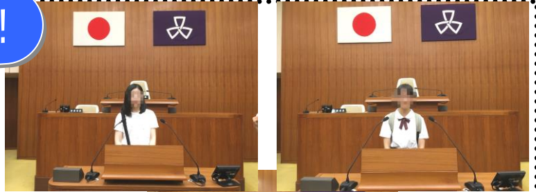
本会議場で記念撮影

☆区議会本会議・委員会傍聴、駅頭での区政報告配布、区の施設見学、地域の行事参加など、積極的に取り組んでくれました。10代の若者が政治や社会の仕組みに興味を持ってくれるように、受け入れを続けていきたいと思ひます。