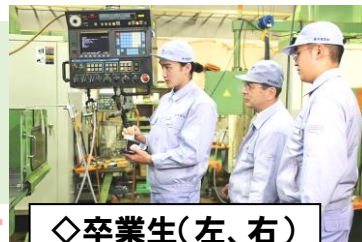
◇卒業生(左、右) 品川区HPより

A: 覚悟をもって日本にやってきている。順調に仕事をしている状況。専門の委託業者が会社を支援・指導している。今年は、外国人を受け入れる企業対象に支援の仕方等をオンラインでセミナーをしている。既に5社6名が内定し、来年1月に来日予定。