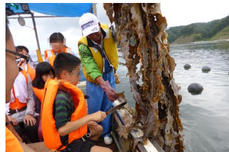
船で宮古湾内のカキ養殖を見学。海中から引き揚げて説明してくれました(左)。昆布でカキが隠れています。昆布を切る初体験も(右)。震災時、津波で湾内のカキは、すべて陸上に流されました。