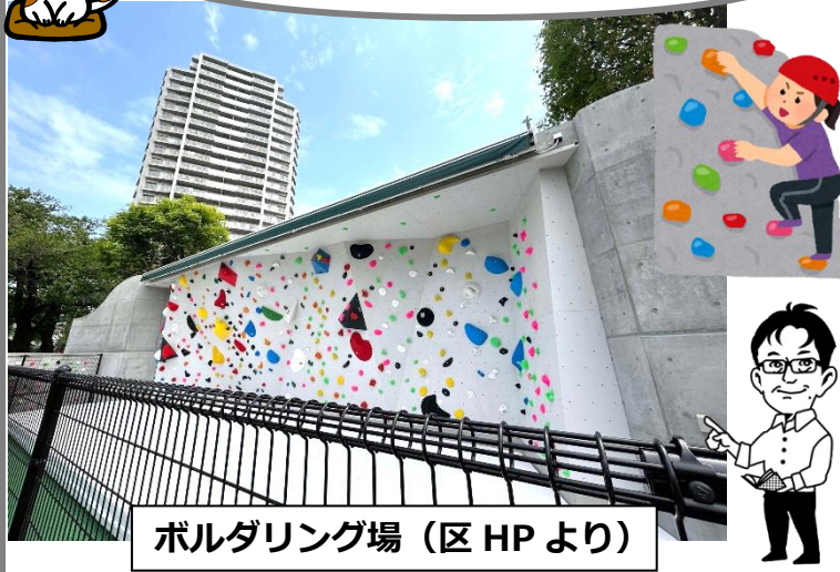
ボルダリング場 (区HPより)