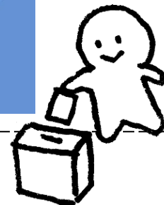
東京 23 区