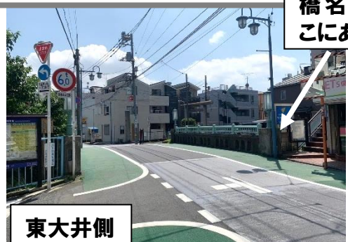
橋名板はここにありす