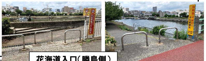
花海道入口(勝島側)