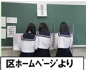
区ホームページより

A: ①今後投票に行こうと思う⇒58.4%、興味関心を持った⇒76.6%、おおむね好意的、実践的だった。しかし、内容の理解度は、50数%。今後に生かしたい。②4、5校は、今年度内に実施したい。③ハースティカードは、区民の皆さんに20歳の誕生日の前月におめでとうのカードと選挙啓発のものを送る事業。対象が18歳以上となり4000人以上増える。全員に届くように工夫、検討したい。