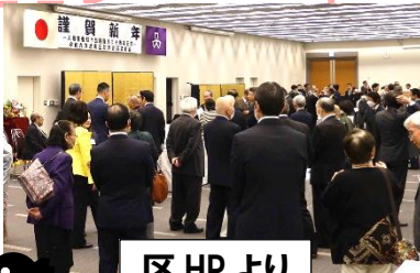
区 HP より

注 新年賀詞交歓会=1/5 に区政協力委員や民生委員の方をはじめ、各地域・各分野で品川区政の推進にご協力された方、区の幹部職員など、約540人が一堂に会して交流しました(写真↓)